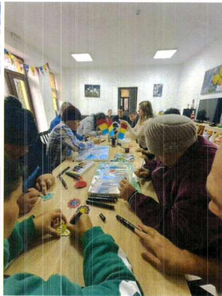
Activități în cadrul Centrului de zi Tg. Ocna