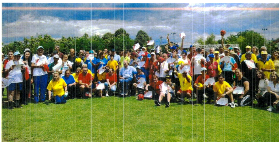
Imagine de la competiția sportivă: "UNIȚI PRIN MIȘCARE"