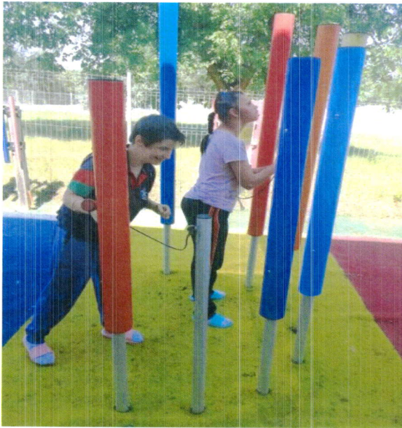
Activitate grădina senzorială a beneficiarilor de la CSSPD Tg. Ocna.