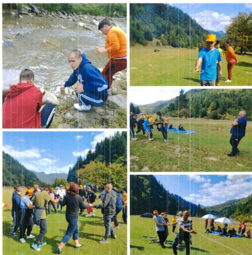
leșire în natură CSS Dărmănești