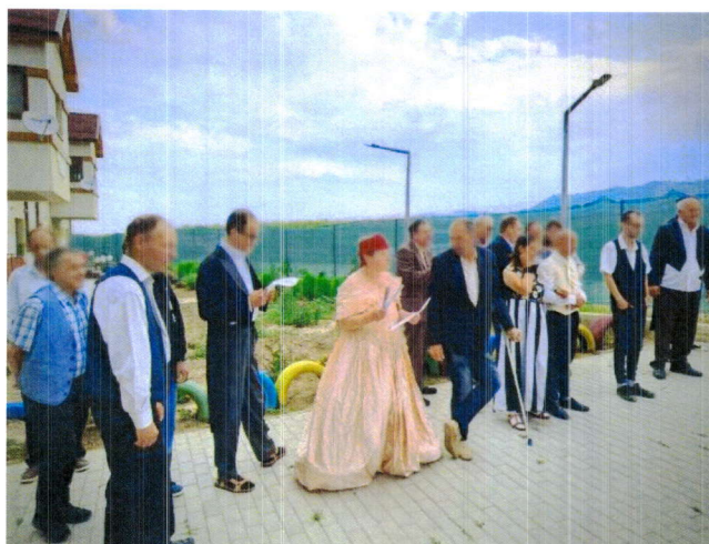
Activități în cadrul proiectului POCU 130548.

Evenimentele organizate de către D.G.A.S.P.C. Bacău în anul 2023, au avut ca scop principal motivarea și stimularea persoanelor cu dizabilități, atragerea atenției opiniei publice asupra problematicei acestora cat și implicarea comunității locale în diverse activități de voluntariat.