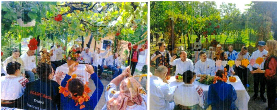
Activități cu beneficiarii din cadrul centrului CABR Comănești.

În cadrul serviciilor sociale, se desfășoară activități specifice persoanelor cu dizabilități și persoanelor vârstnice în vederea dobândirii abilităților pentru o viață independentă, necesare integrării în comunitate.