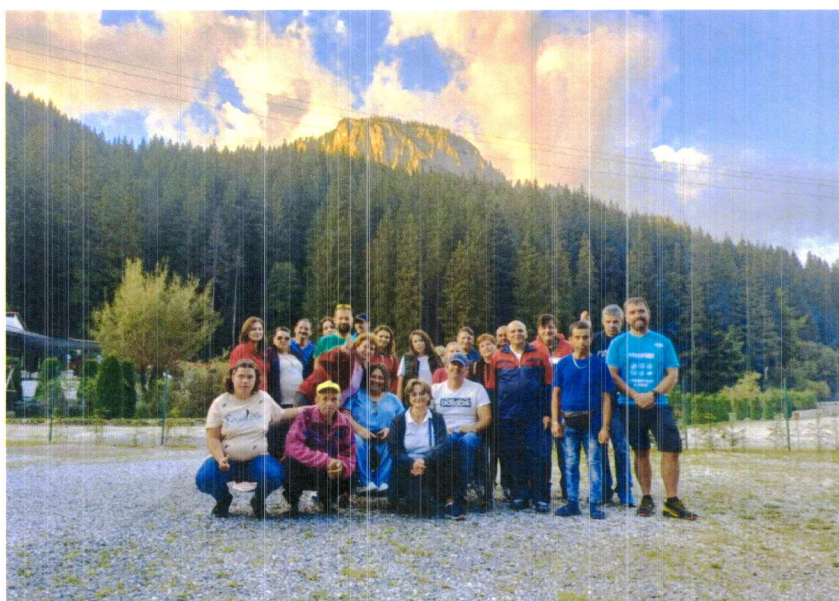
Excursia la Lacul Roșu a beneficiarilor din cadrul proiectului POCU 130550.