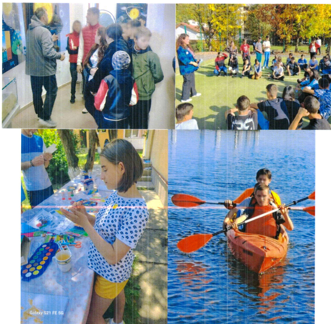
Imagini de la activitati realizate in cadrul serviciilor rezidentiale