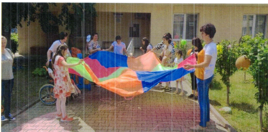
Imagini de la activitati din cadrul serviciilor de recuperare destinate copiilor cu dizabilități